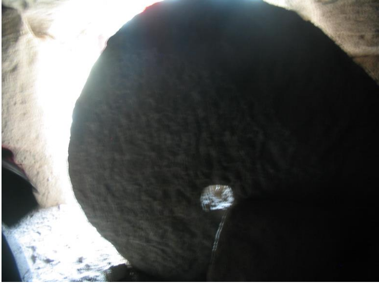
Oyulmuş galerinin önündeki yuvarlak taşan kapı.