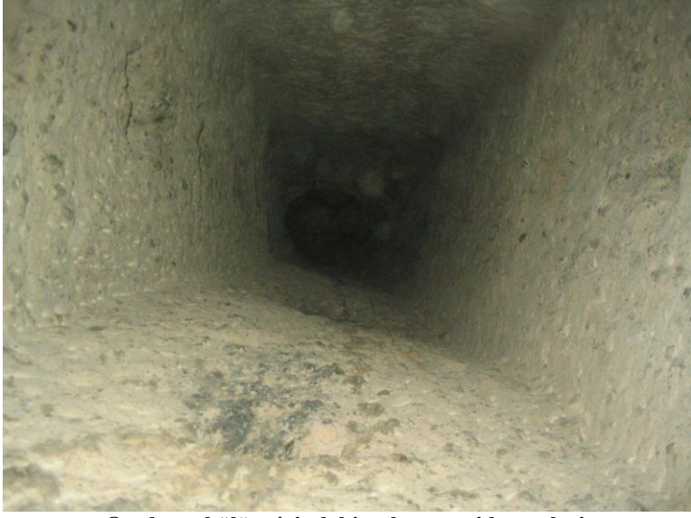
Oyulmuş bölüm içindeki yukarıya giden galeri.