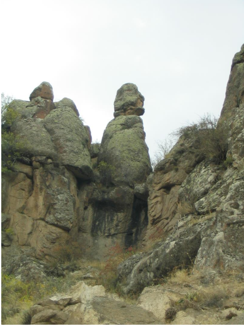
Zeytin tanesinin düştüğü peri bacası.