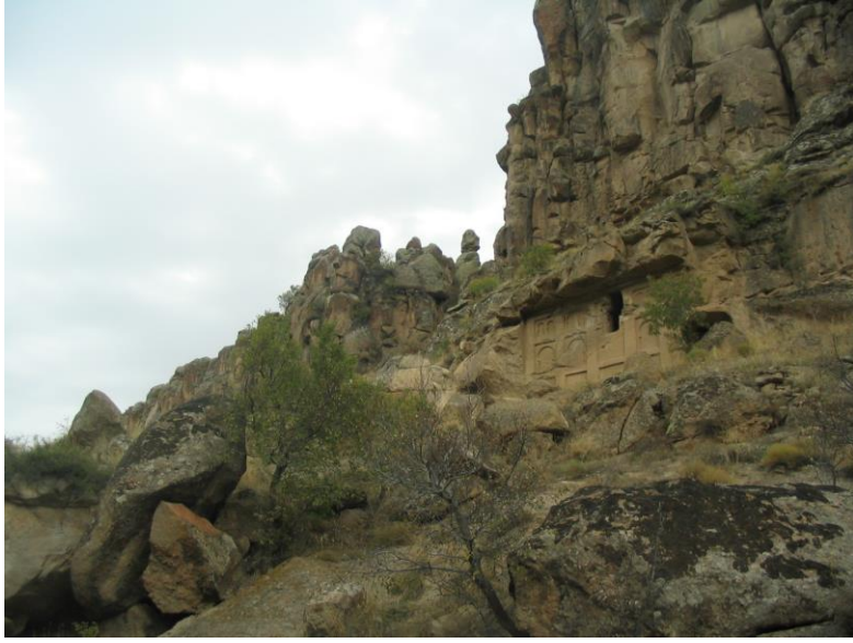
Celsede sözü edilen Agarta kapısının olduğu kaleye benzer kaya kütlesi ve yanındaki peri bacası.